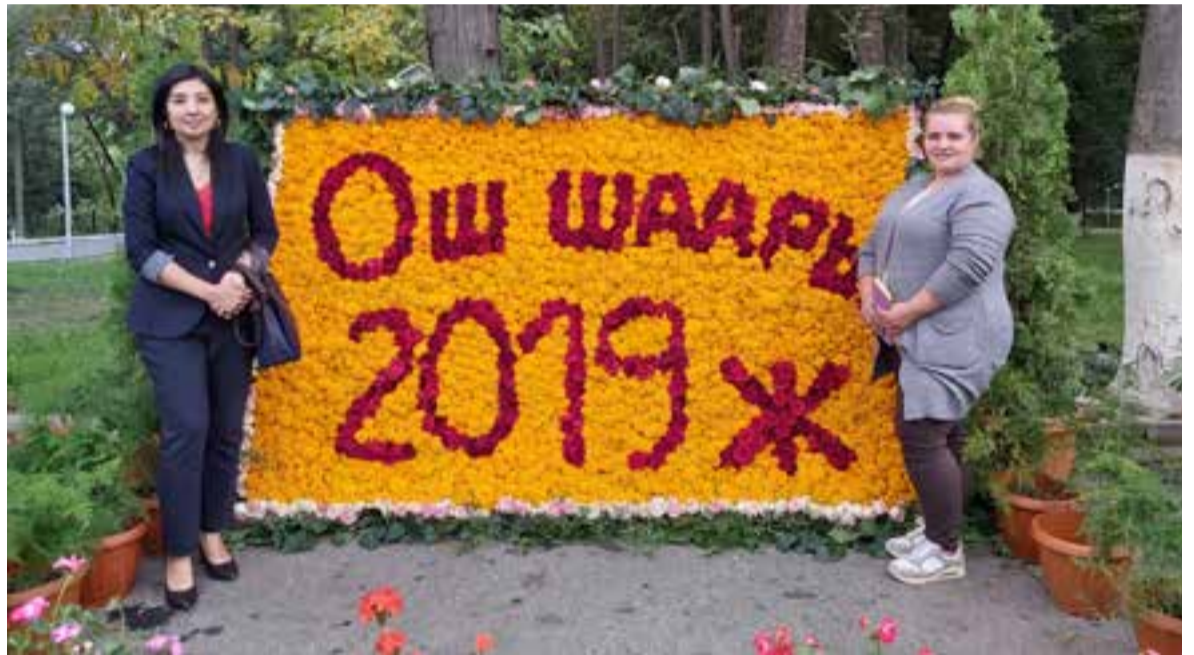
В рамках рабочей поездки премьера