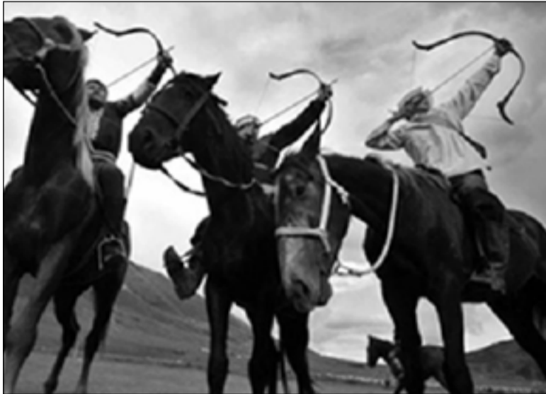
Первые Национальные игры кочевников