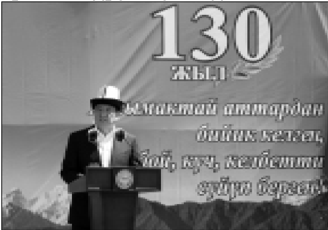
Президент Кыргызской Республики Сооронбай Жээнбеков 30 июня принял участие в праздничных мероприятиях по случаю 130-летия Каба уулу Кожомкула в Суусамырской долине Жайылского района Чуйской области.

В своём выступлении глава государства отметил, что Кожомкул баатыр был выдающейся личностью своего времени, прославивший кыргызский народ своими благородными делами.