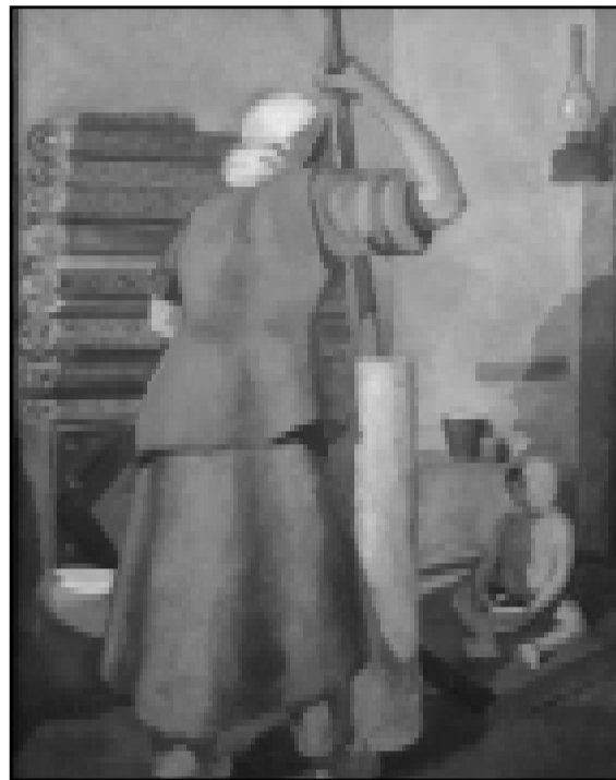
Картина Исмаиллы Атамкулова.

сударством 110 сомов на одного ребенка в день. Все расходы на специальные предметы за