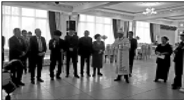
Коллектив редакции газеты “Эхо Оша” сердечно поздравляет своих коллег с их юбилеем и желает новых творческих успехов.