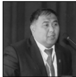
ректор ОГПИ, кандидат педагогических наук, профессор.

Уважаемые сотрудники редакции газеты "Эхо Оша"!